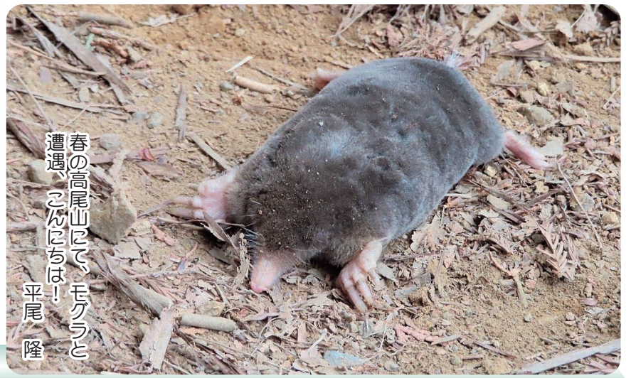
春の高尾山にて、モグラと遭遇。こぶにちは！ 平尾 隆