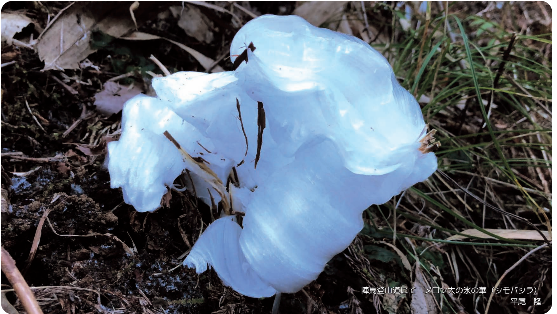
陣馬登山道にて メロン大の氷の華（シモバシラ） 平尾 隆