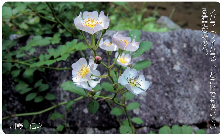
ノバラ（ノイバラ）。どこにでも咲いている清楚な野の花。