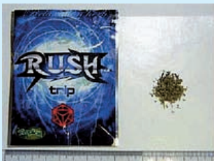
植物片状の商品 合法ハーブとして販売