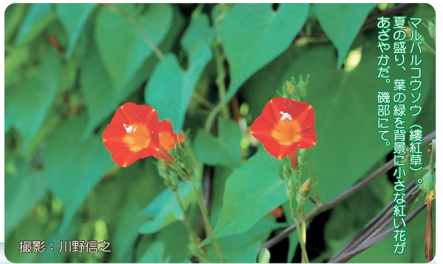
マルバルコウソウ（纒紅草）。夏の盛り、葉の緑を背景に小さな紅い花があざやかだ。機部にて。