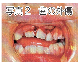
写真2 歯の外傷 参考文献：スポーツ歯科臨床マニュアル 著者：日本スポーツ歯科医学会