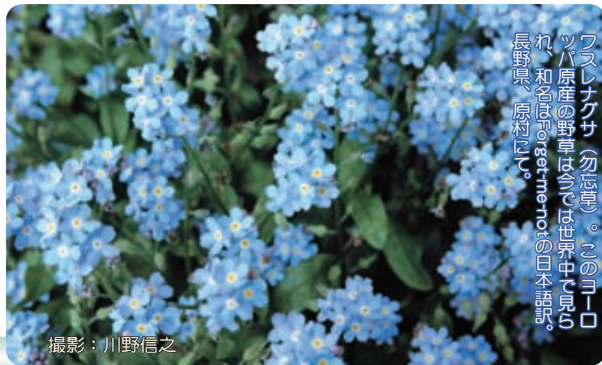
フスレナグサ（勿忘草）。このヨーロッパ原産の野草は今は世界中で見られ、和名はForget-me-notの日本語訳。長野県、原村（原）。